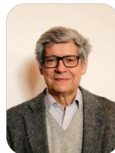
Jean François SOR- NEIN